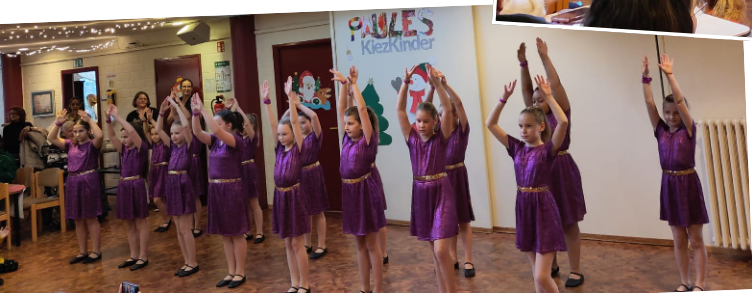
youngPOWER GIRLS Dienstag