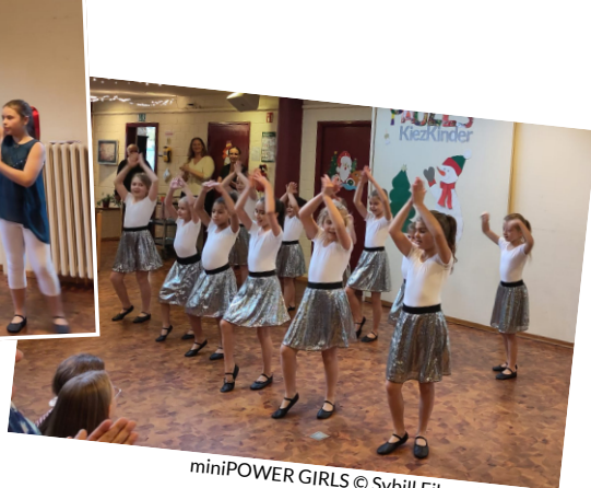
miniPOWER GIRLS

Ab Januar laufen die Vorbereitungen für die Bühnenshow in der Jugendtheaterwerkstatt Spandau auf Hochtouren, und es können Karten reserviert werden.