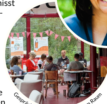
Gespräch mit Eltern im geschützten Raum

Es darf auch etwas leichter sein, z.B. beim Elterncafé. Nicht immer soll es um schwere Gespräche gehen, sondern auch darum, eine gute Zeit miteinander zu haben. Vielleicht mit anderen Eltern einfach nur schnacken, eine kleine Pause machen. Diese Zeit als Familie kann man zudem beim 2x im Jahr stattfindenden Familientag erleben. Auch bei diesen Veranstaltungen - ich bin dabei.