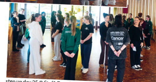
step up day 25