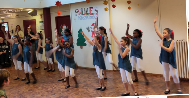
youngPOWER GIRLS Donnerstag

leichter gelingen, die Konkurrenz zwischen den Gruppen vermindert und ein besseres Teamgefühl im Gesamtprojekt POWER GIRLS gefördert werden kann. Herzlichen Dank an alle Trainerinnen, die den Tag mitgeplant, vorbereitet und begleitet haben!