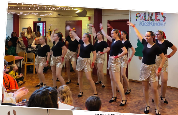
teenyPOWER GIRLS Montag